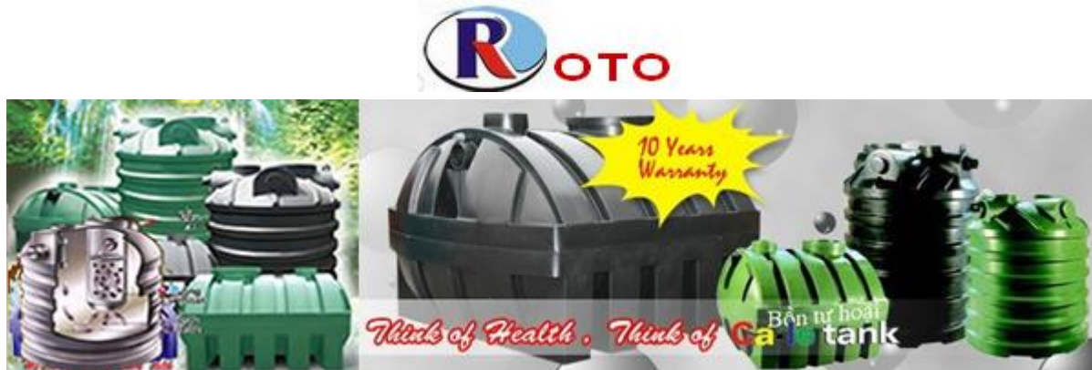
Bảng thông số kỹ thuật và giá bán bồn tự hoại Roto